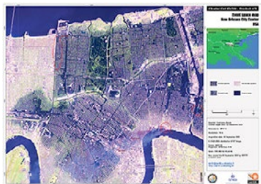
Les effets du cyclone Katrina. Spatiocarte événementielle (SERTIT, Strasbourg, 16 septembre 2005)

Si l'on envisage les transformations de la cartographie, on songe immédiatement à celles qui ont été induites par la révolution numérique et l'usage de l'internet. Il faut pourtant se détacher d'une approche trop contemporaine pour saisir les mutations qui ont affecté la production et la circulation des cartes. Qu'est-ce qui change en cartographie, ou comment change la cartographie ? Pour répondre à ces questions, nous nous appuyons sur le modèle classique de la communication cartographique, afin de repérer les modalités d'un changement qui est loin d'être exclusivement technique.