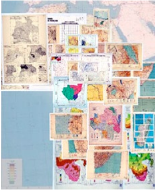
Quelques fonds cartographiques du Laboratoire de Graphique de l'EHESS

La plateforme géomatique porte une partie de l'héritage du laboratoire de graphique de l'EHESS fondé par Jacques Bertin. Depuis, les méthodes de conception de cartes et surtout des analyses qui peuvent en découler ont bien changé et s'insèrent à la fois dans le paradigme du « Spatial Turn » au début des années 2000 et qui rebondit aujourd'hui dans les « Spatial Humanities ». L'objectif est donc de promouvoir les ressources numériques, les données et les connaissances, acquises ou produites par les chercheurs de l'EHESS sur une multitude de projets émanant de disciplines des sciences humaines et sociales (histoire, géographie, archéologie, anthropologie, ethnologie, etc.) ayant vocation à spatialiser des informations. Notre présentation s'articulera autour de plusieurs projets phares auxquels la plateforme collabore et portera sur le SIG, l'analyse spatiale, le traitement automatique des langues, l'intelligence artificielle et l'apprentissage automatique et le Web sémantique.