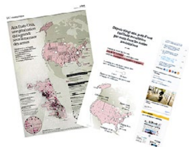
Aux États-Unis, une génération sous la menace des armes (Le Monde du 25/26 mars 2018)

La cartographie a toujours été présente dans les pages du Monde et cela depuis la carte du plateau du Vercors publiée à la Une le 8 août 1945. Cartes de localisation, cartes électorales, cartes d'analyse géopolitique... les cartes sont devenues un atout pour le quotidien papier. Cependant depuis quelques années, la presse se consomme de plus en plus sur Internet et le service de cartographie est passé à la cartographie numérique. Ordinateur puis mobile, la lecture sur support numérique nous force à remettre en question nos pratiques. Mode de lecture, format : la cartographie sur le Web se pense différemment de celle sur papier. Alors que nos cartes papier sont souvent complexes avec une démonstration et une superposition d'informations, le web nous pousse à décomposer celles-ci. Comment conserver notre raisonnement et le niveau d'analyse des cartes papier tout en proposant des cartes simples et lisibles sur un écran de téléphone ? Tel est l'enjeu quotidien de notre service.